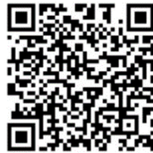
高雄市政府衛生局營養宣導影片