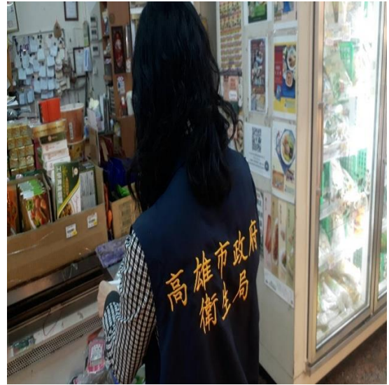
2. 稽查人員於市場採檢