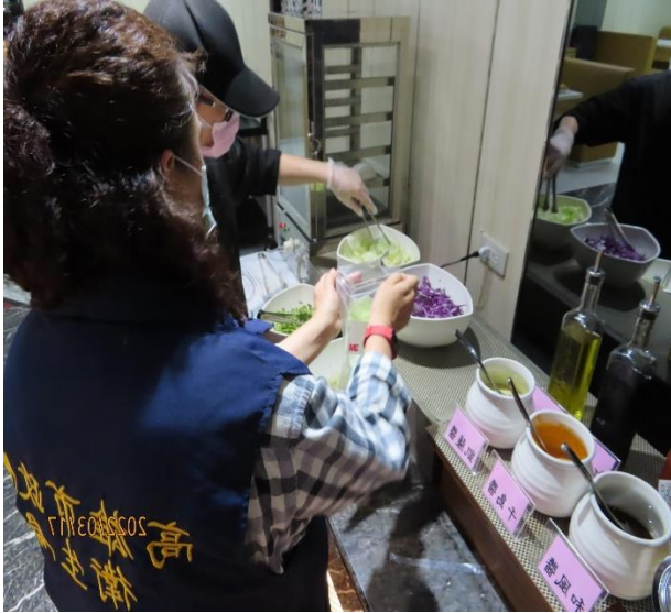
1. 稽查人員於餐飲業採檢