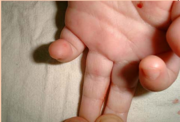
腸病毒 71 型引起的手足口病，手掌出現非 常細小的紅疹。