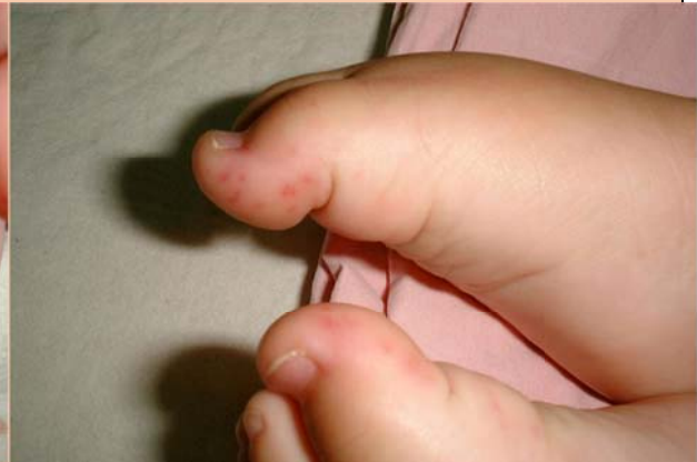
腸病毒 71 型引起的手足口病，腳掌出現非 常細小的紅疹。