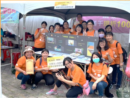
【友愛智者，社區相伴】