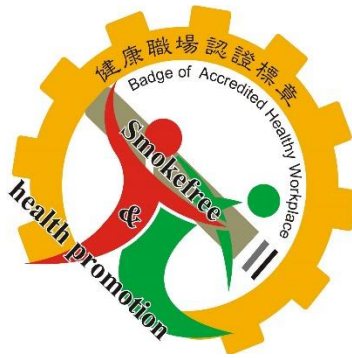
健康職場認證-健康啟動標章