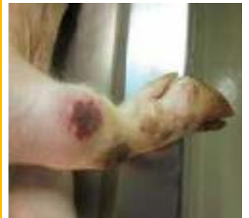
圖：關節腫脹伴隨皮膚壞死