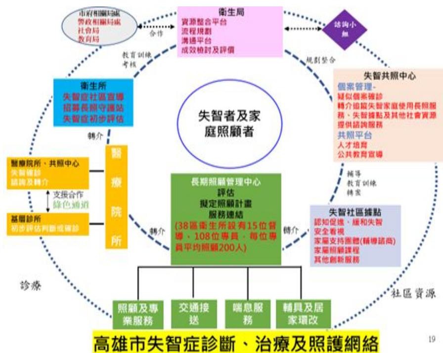
圖 1、高雄市失智照護網絡示意圖