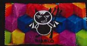
超級搖頭丸毒咖啡(PMMA)